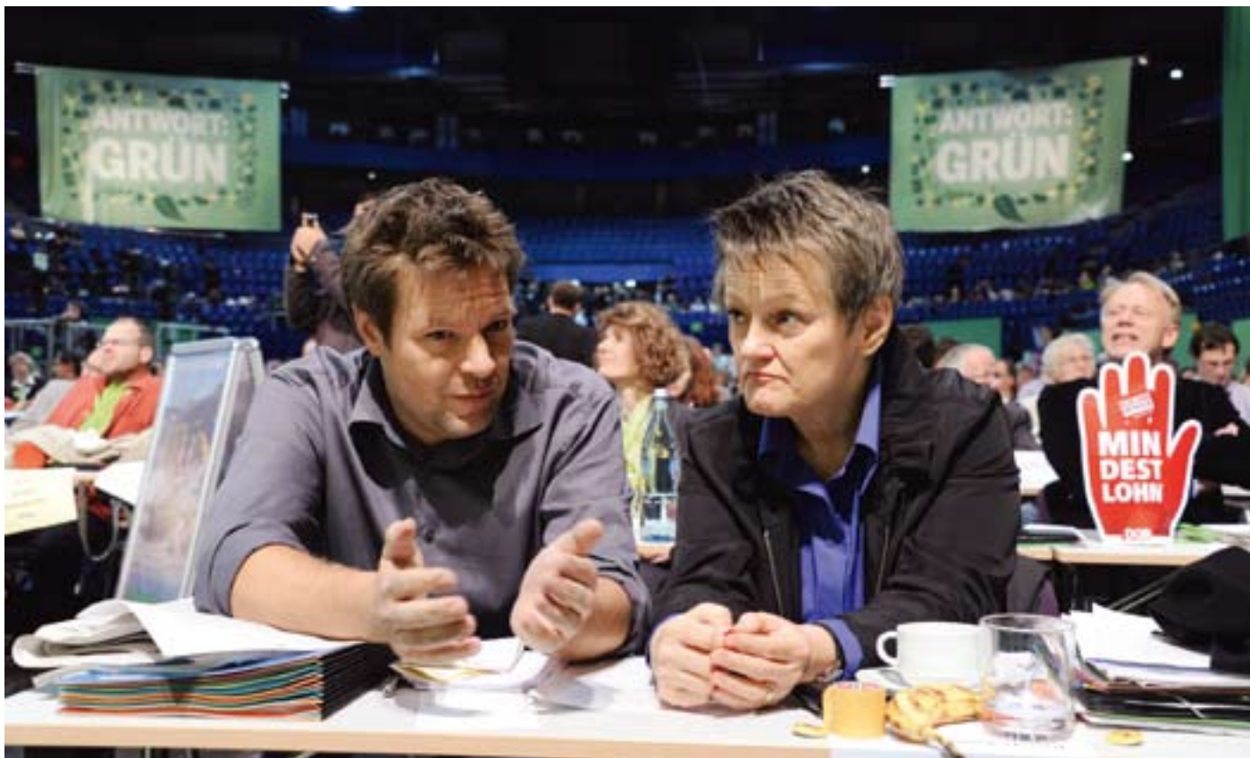
Sind sich nicht grün: Kandidat Robert Habeck (l.) will nicht so, wie die Bundestagsfraktionschefs Renate Künast und Jürgen Trittin es gern hätten

„Wir brauchen ein Wirtschaftsministerium, das sich als Dienstleister versteht“, wirft Habeck seinen ersten Köder aus. Das klingt schon mal gut. Ein bisschen nach FDP, auch wenn es aus dem Mund eines Grünen kommt.